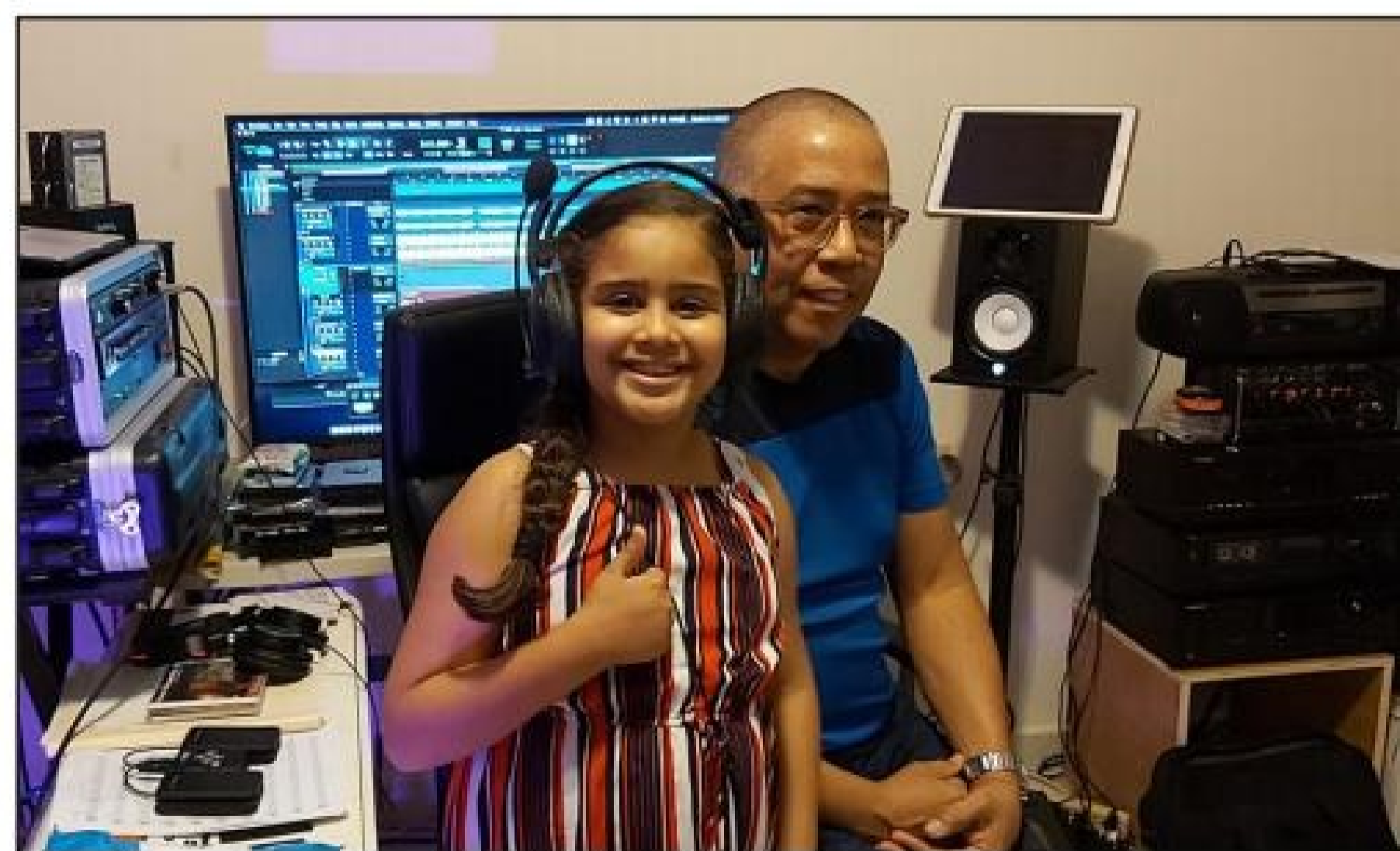
Aruba Ocean Villas y Tres .